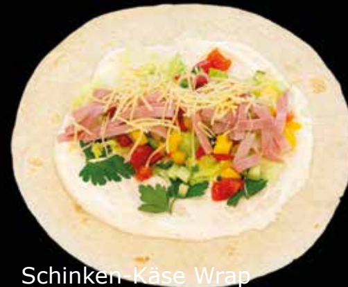
Schinken Käse Wrap