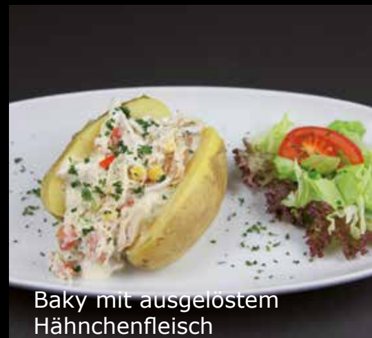
Produkt - Beispiele