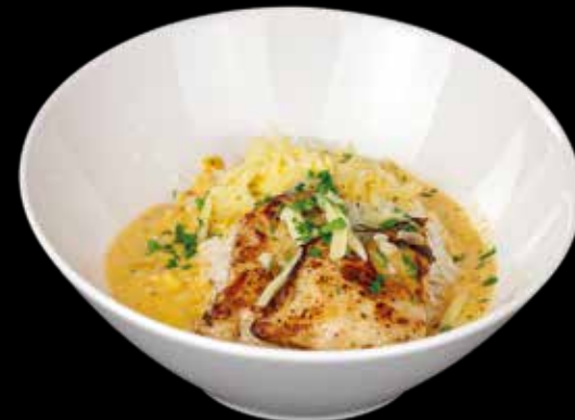
DKK Woxx Creamy