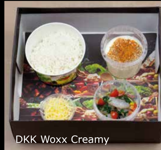
DKK Woxx Creamy