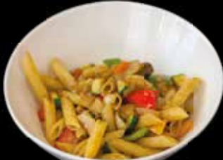
Noodles Oriental 7,00 € mit orientalischem Gemüse