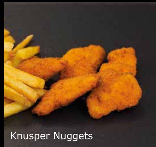
Produkt - Beispiele