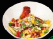
Noodelsalat 7 mit Paprika, gebrühter Soße, Petersilie und Soße nach Wahl 5,00 €