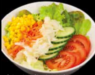
Salatschale Classic 3,80 €

Frühen Sie unsere Mitarbeiter nach der Zusatz- und Allergienachrichtigung