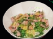
Reissalat 7 mit Kochschinken, Erbsen, Petersilie und Soße nach Wahl 4,80 €