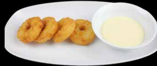
Apfelringe mit Vanillesoße