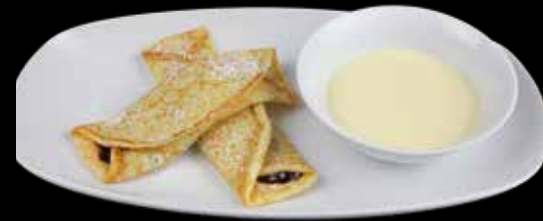
Blaubeerpfannkuchen mit Vanillesoße