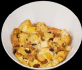
Schwäbischer Ofenschlupfer 5,00 € mit Äpfeln und mit Vanillesoße